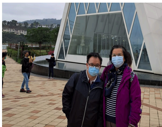
現在的志洋亦時常陪伴在媽媽身邊

「我的媽媽很有愛心、喜歡幫助別人，是個非常體貼的人，她多年來都做無不至地照顧我。」這是志洋對媽媽的印象，亦是最愛媽媽的特點。「我的媽媽很會做手作品，她做的手製太陽花我十分欣賞」志洋道。在疫情前，志洋一家人曾出遊澳門：「那天我們拍了很多照片，吃了當地著名的美食，例如：豬扒包和葡撻，真的非常難忘，但其實只要能與媽媽爸爸在一起，就是最開心的。」