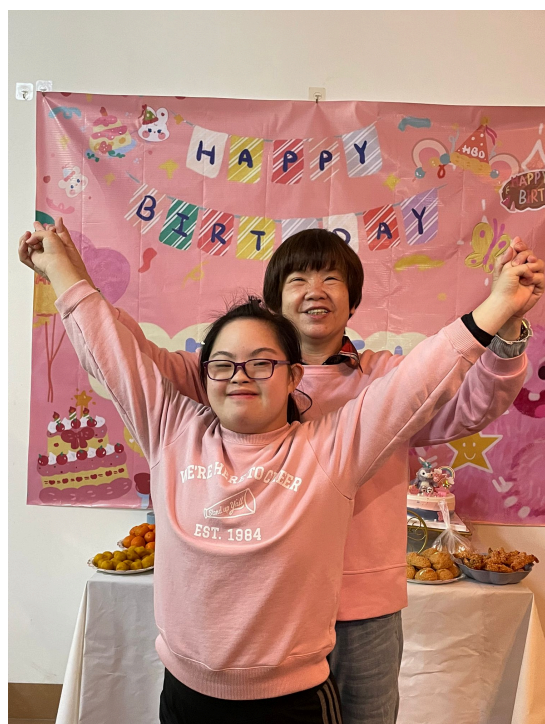
雯晶媽媽仍然會為雯晶慶祝生日