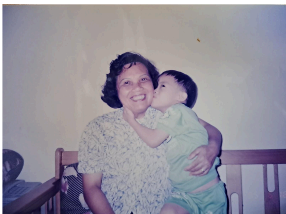
志洋的親吻令媽媽展開燦爛的笑容